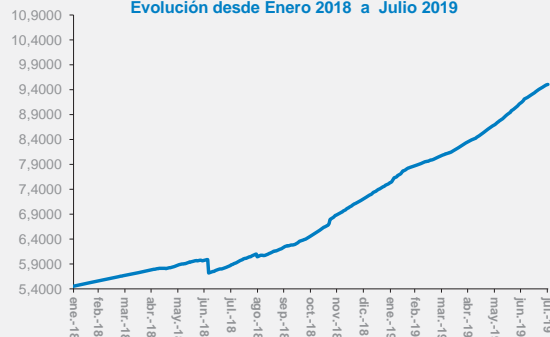
Evolución desde Enero 2018 a Julio 2019

Contacto - Centro de Atención Telefónica - 0810 - 555 - 2355