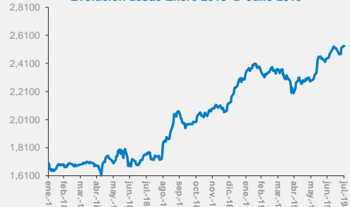
Evolución desde Enero 2018 a Julio 2019

Contacto - Centro de Atención Telefónica - 0810 - 555 - 2355